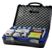
ENOCEAN technologija belaidė ir be elementų